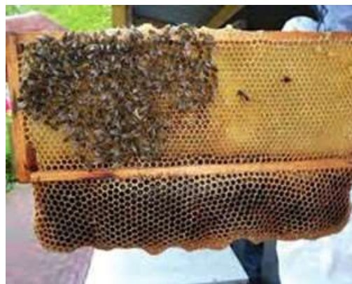
Darrenraat wordt onderaan het bovenliggende raam gebouwd

Door plaatsgebrek zal er snel een nieuwe romp aan de kast toegevoegd moeten worden. We zetten we een nieuwe romp onderaan bij, waardoor het broednest bovenaan komt te zitten. Best zetten we hier een aantal reeds opgebouwde ramen in (beginnende imkers hebben die natuurlijk niet). Aan één van de zijkanten laten we een raampositie open. Wanneer de dames ook de onderste broedkamer stevig gaan bezetten, zullen ze beginnen darrenraat bouwen aan de onderlat van het raam boven de lege positie. De voortgang van de bouw van dit darrenraat kunnen we dan gemakkelijk nakijken door enkel dat raam op te tillen en te kijken hoever het staat. Op het moment dat dit mooi opgebouwd is snijden we de darrenraat weg (dit is trouwens hele zuivere was) en wisselen we bovenste en onderste romp van plaats.