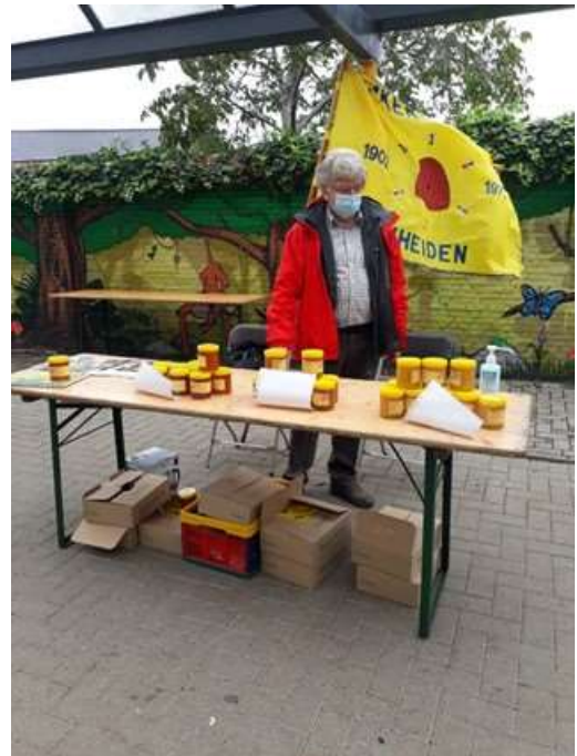
Onze voorzitter op de "bijenstand"