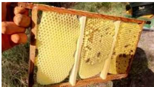
Door een driedelig raam te gebruiken kan darrenraat in verschillende stadia bekeken worden

We gebruiken vanaf nu een leeg raam op de 1 ste of 2 de positie, waarin weerom darrenraat zal gebouwd worden. Gezien de varroamijten zich graag nestelen in darrenbroed, kunnen we nu al efficiënt actie nemen tegen varroabesmetting: Het darrenbroed komt uit na 24 dagen, dus zeker ééns per 3 weken moet dit darrenraat weggesneden worden. Een tip: een strookje waswafel aan de bovenkant van het raam helpt de bijen hieraan te beginnen. Een bekende techniek is ook om een driedelig raam te gebruiken, waardoor darrenraat in verschillende stadia kan bekeken worden.